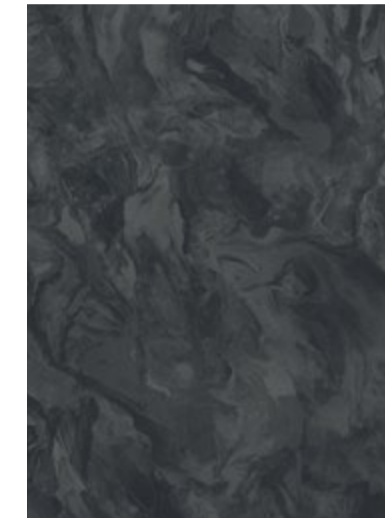
3704 Gris Marbré