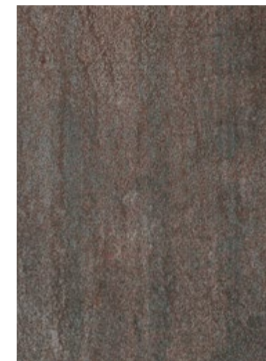
3708 Monnaie Brossée