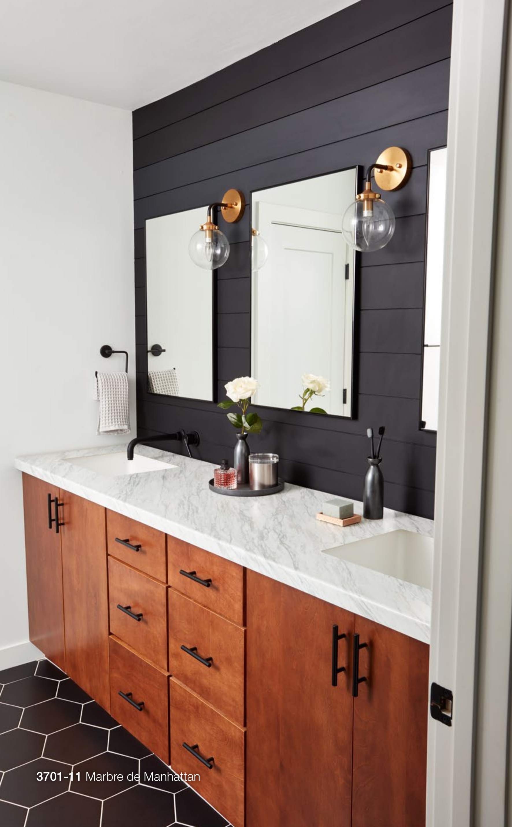
3701-11 Marbre de Manhattan