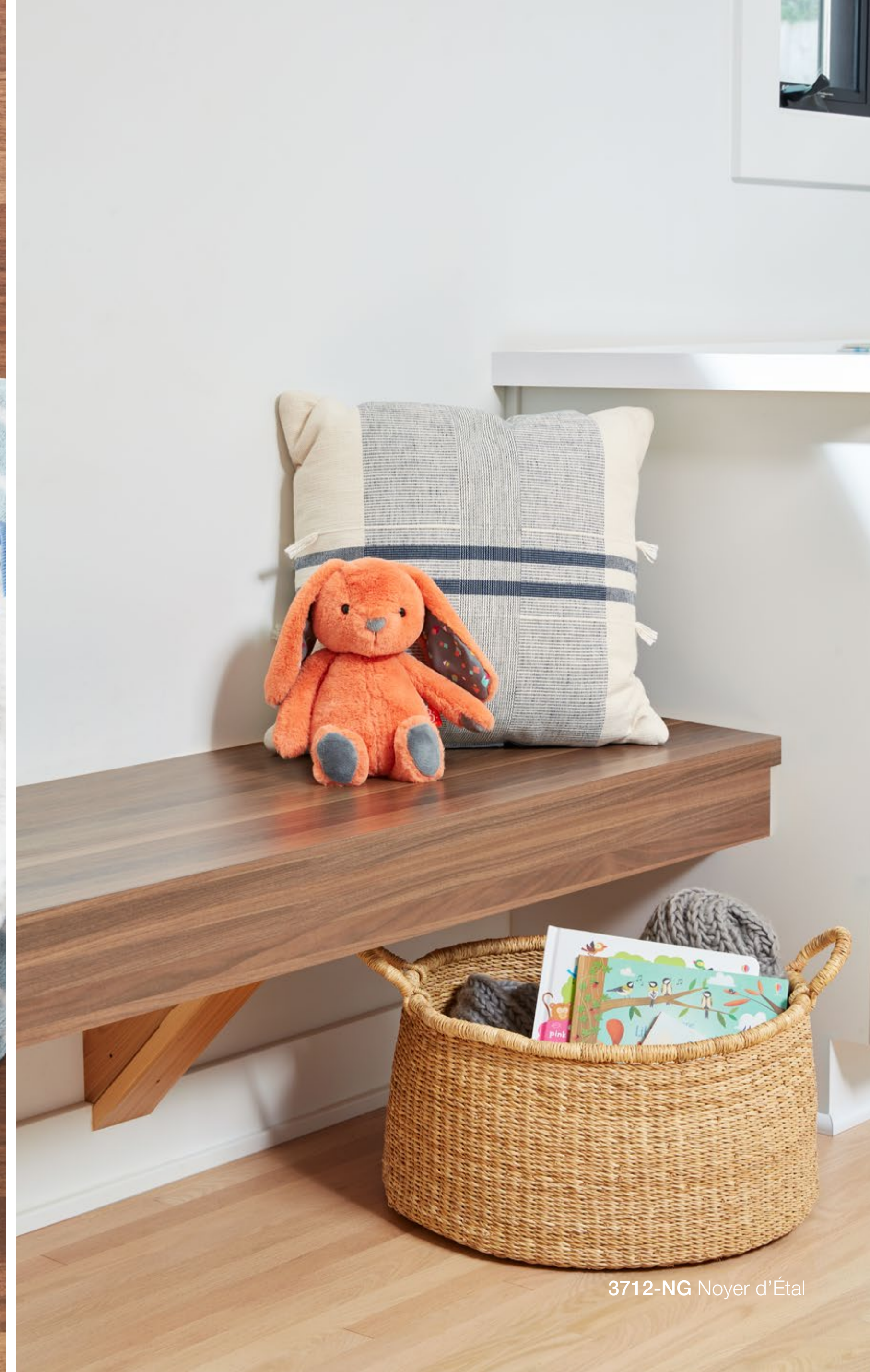
3712-NG Noyer d'Étal