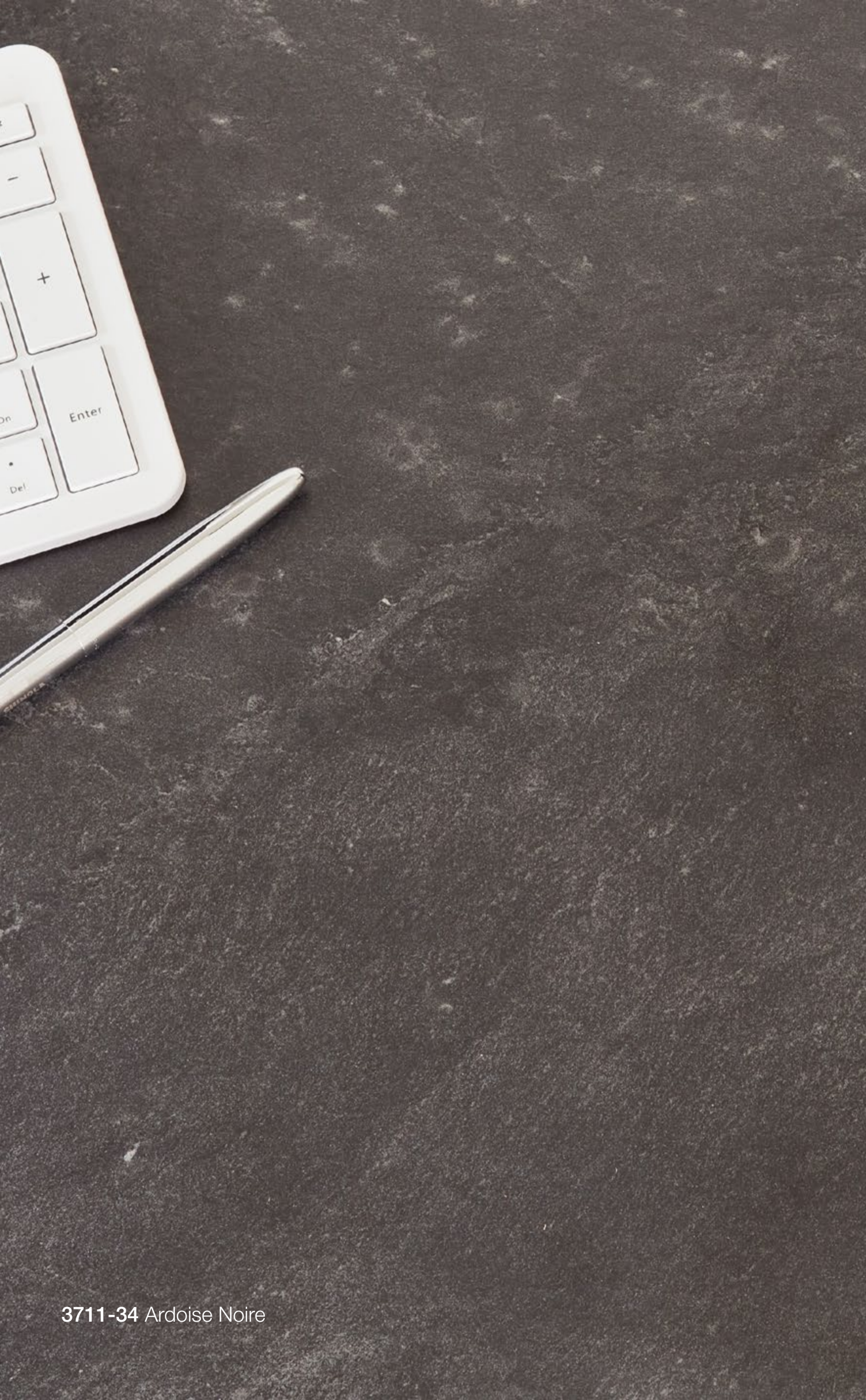
3711-34 Ardoise Noire