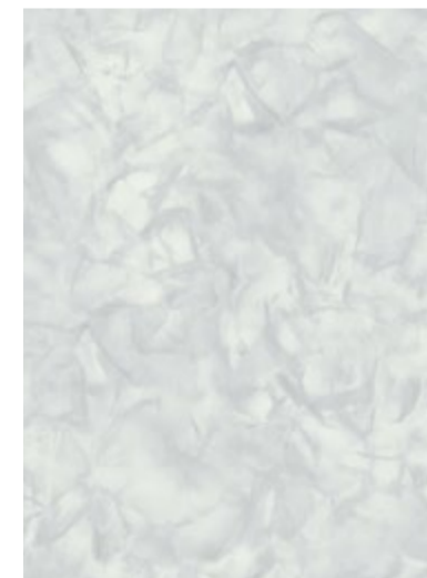
3705 Cristaux de Sucre

COMBINEZ ET AGENCEZ DES COULEURS UNIES, DES MOTIFS DE GRAINS DE BOIS, DES MOTIFS GRAPHIQUES OU DES IMITATIONS DE PIERRE POUR RÉALISER VOS PROJETS.