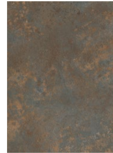
3707 Bronze Patiné