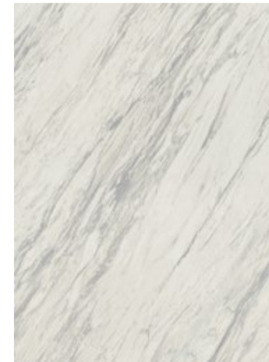
3701 Marbre de Manhattan