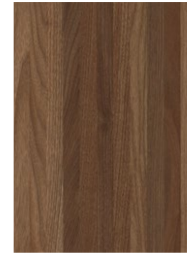
3712 Noyer d'Étal