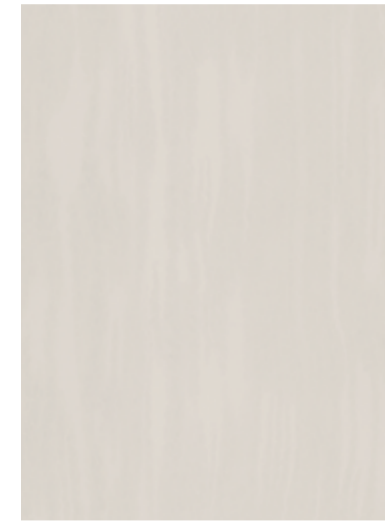
3720 Cascade de Perles Blanches

POUR DES EFFETS SPÉCIAUX SCINTILLANTS DE CRÉATIVITÉ, NOTRE COLLECTION PREMIUMFX ™ COMPREND DES TEXTURES RÉALISTES DE PIERRE ET DE GRAIN DE BOIS - UNE ALTERNATIVE ABORDABLE AUX SURFACES LUXUEUSES.