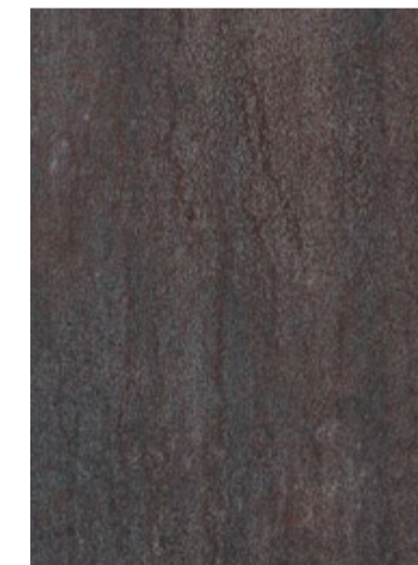
3709 Fer Brossé