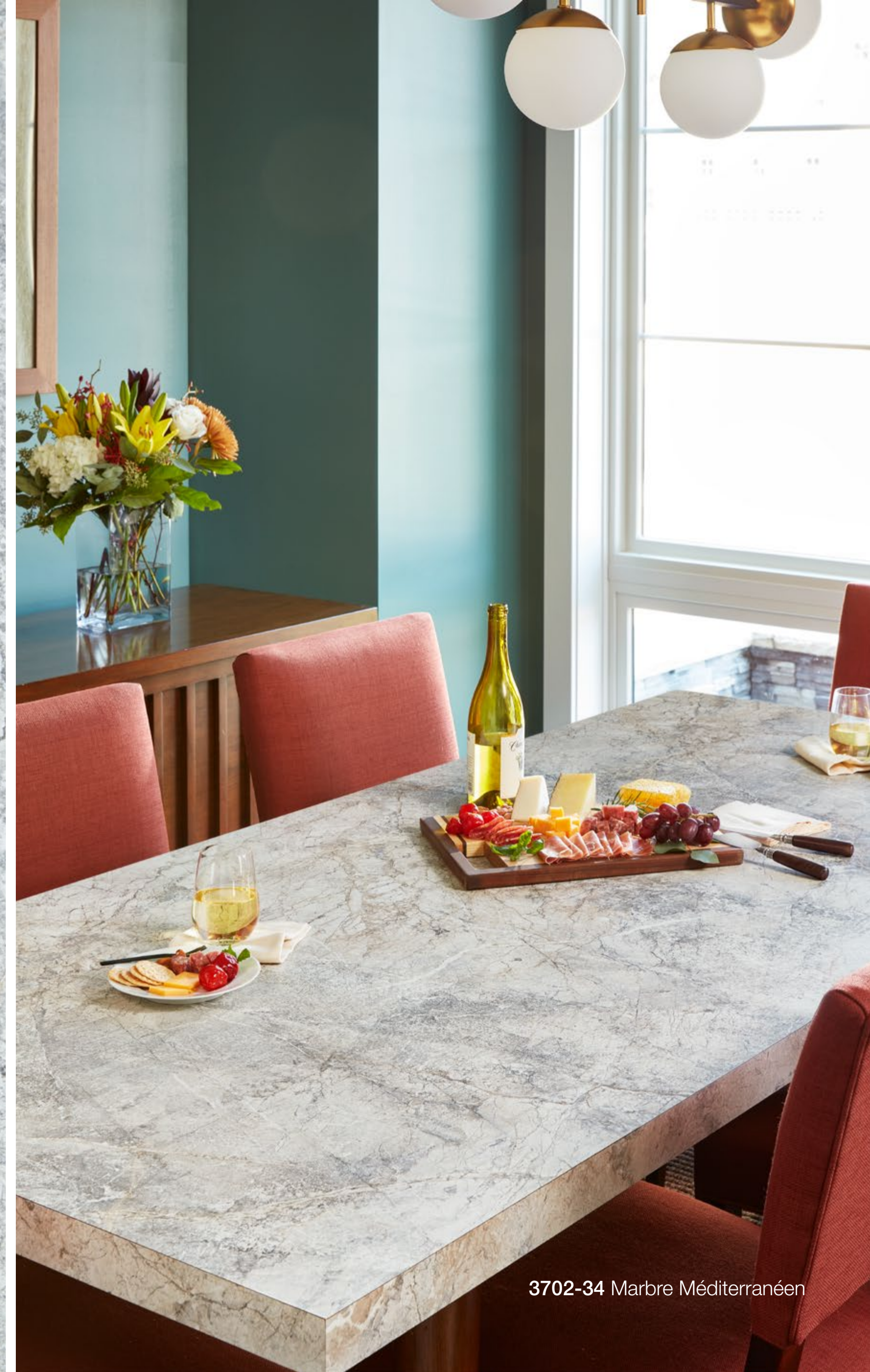
3702-34 Marbre Méditerranéen