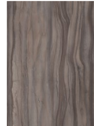
3703 Marbre Boisé