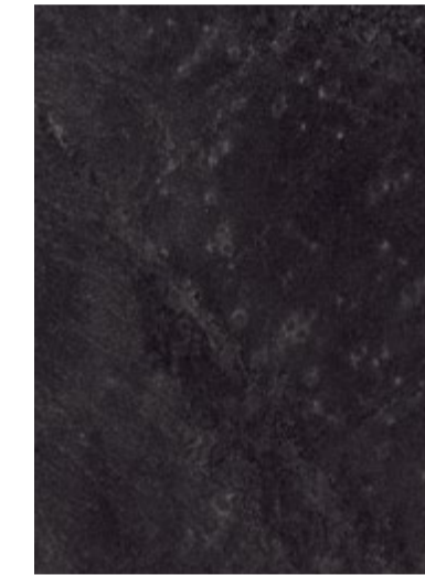
3711 Ardoise Noire