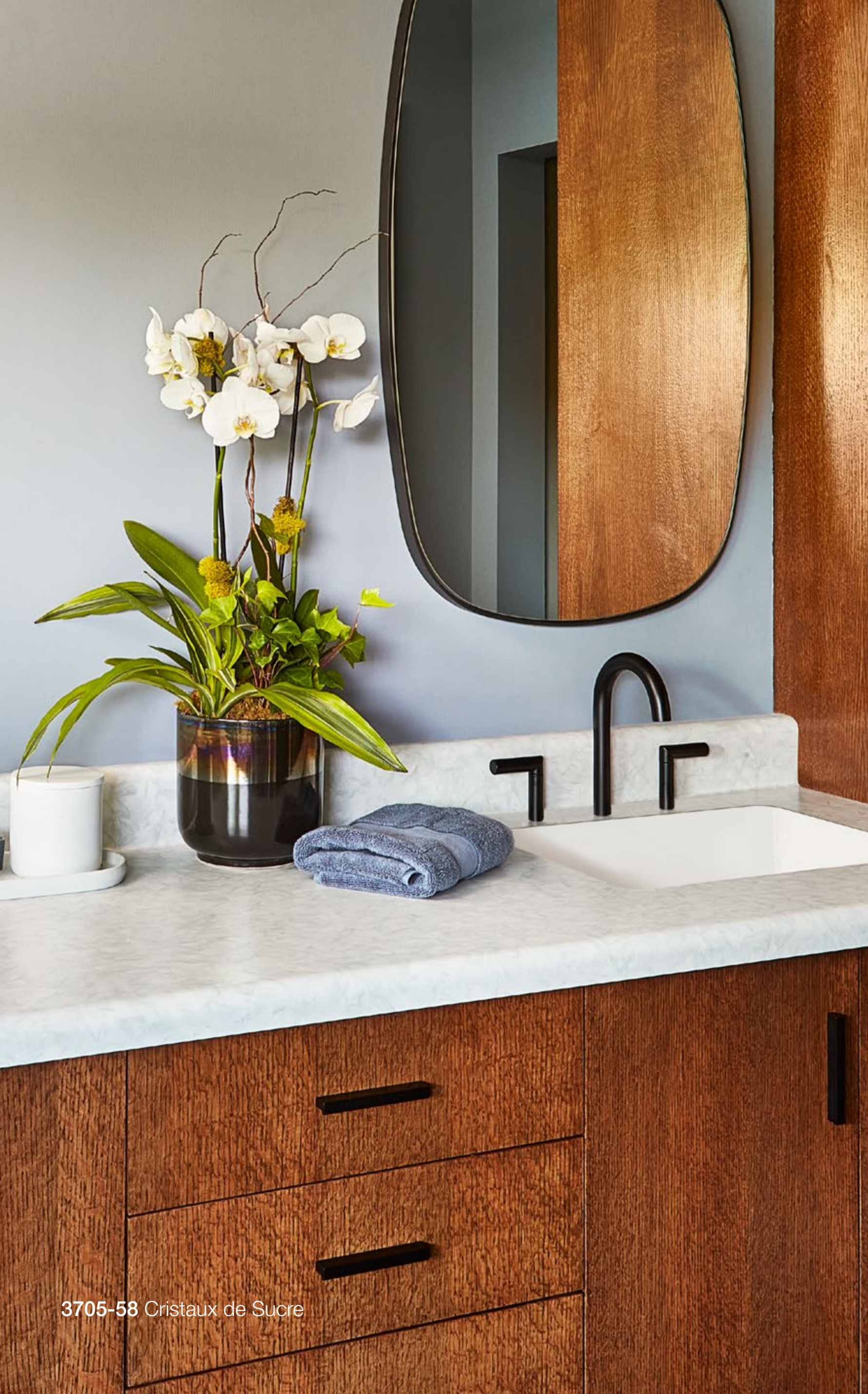
3705-58 Cristaux de Sucre