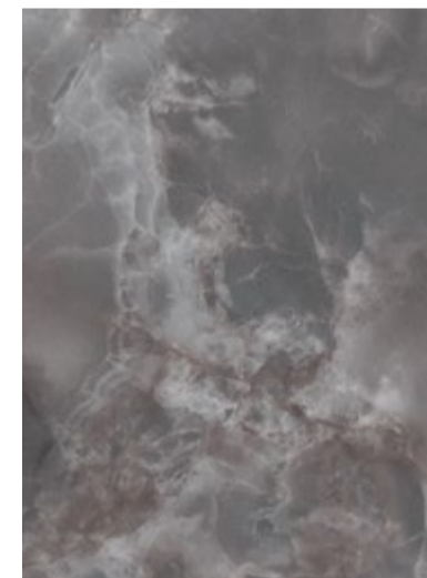
3710 Onyx Fumé