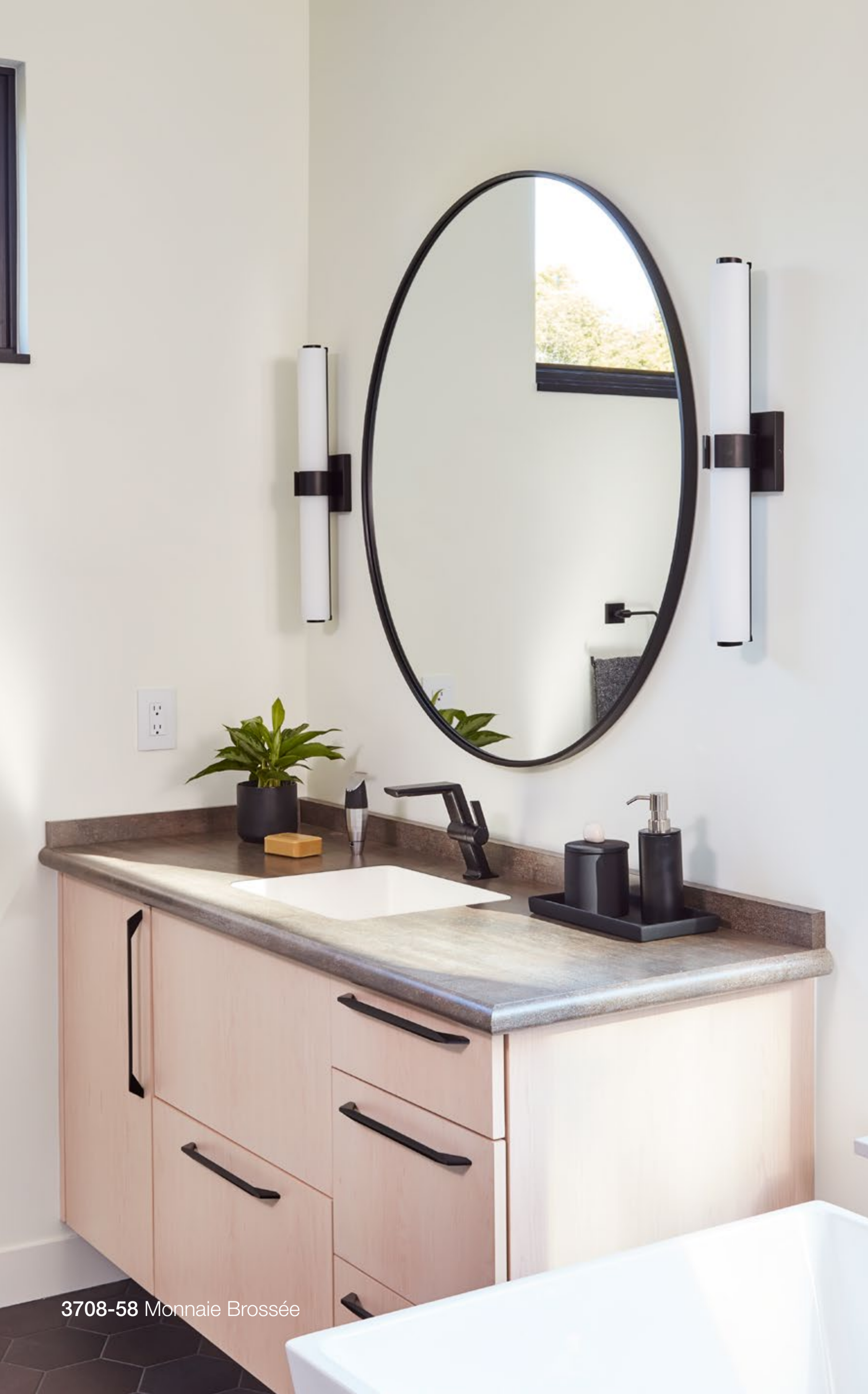
3708-58 Monnaie Brossée