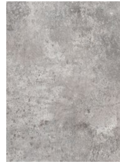
3706 Béton Patiné